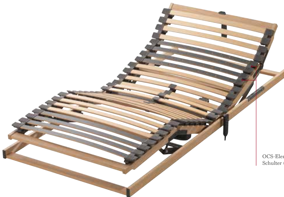
OCS-Element Schulter (0 bis -2)