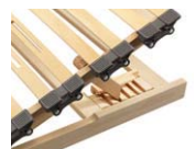
Metallfreier Kopf- und Fußteil