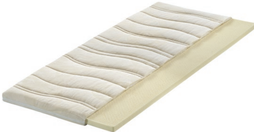
Vita Talalay Latex – aus 100% Naturlatex