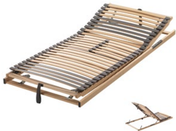
Art.Nr. 073409 (LKF GA) Art.Nr. 073411