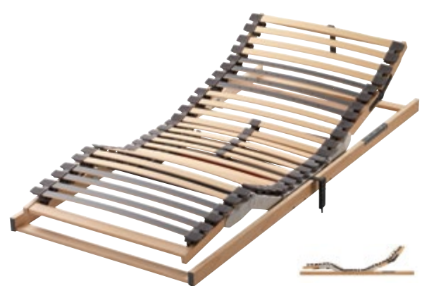
Art.Nr. 073426 (Funk) Art.Nr. 073436