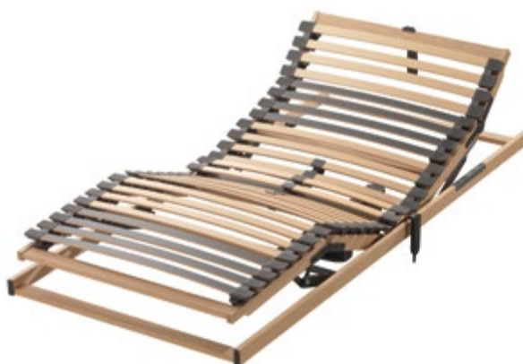
Art.Nr. 073422 (Funk) Art.Nr. 073452